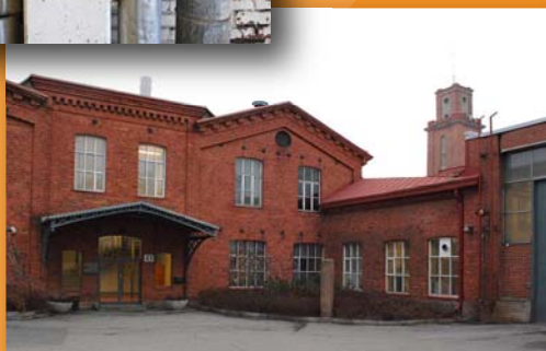
Finlaysonin aluetta Forssassa 2010

Ennakoilmoittautuminen 5.3.2010 mennessä: ELINA ERIKSSON Puhelin: (03) 4240 4732, 050 550 3110, elina.eriksson(at)fskk.fi